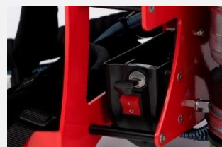
Verrouillage de la batterie