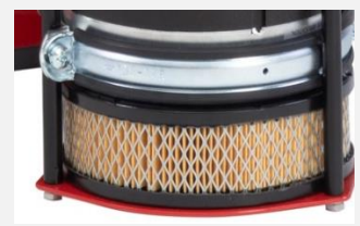
Filtre à air