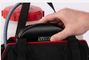
Indicateur de batterie

Le fontan® Portastar E est un véritable nébulisateur ULV qui fonctionne sur batterie et qui est facile à utiliser. La machine produit d'excellentes gouttelettes ULV, conformément aux exigences de l'OMS. Il est possible de passer en mode Eco, ce qui permet d'augmenter l'autonomie de 50 %. La batterie peut être sécurisée par un verrou dans le support de batterie.